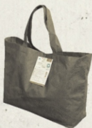
Shoppertasche aus PLA/Mais