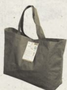
Shoppertasche aus PLA/Mais